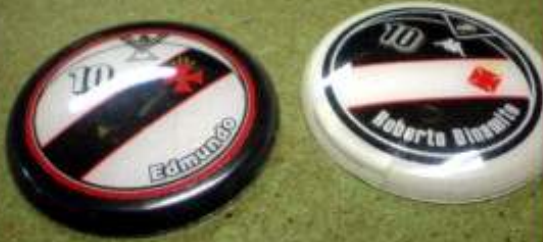
HERÓIS Edmundo e Roberto Dinamite, enfim, comemoram a conquista