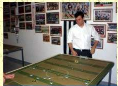
QUASE Voltaço vence o São Paulo, mas cai pra 2ª diante do Guarani