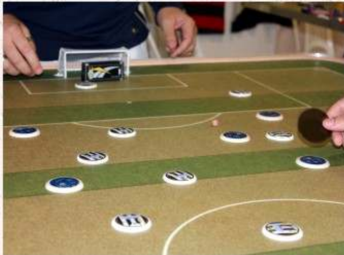
Atalanta não consegue segurar a Juventus do Caboclo Trofaleiro

O mais famoso Diário Esportivo Italiano direto para o BFA Notícias