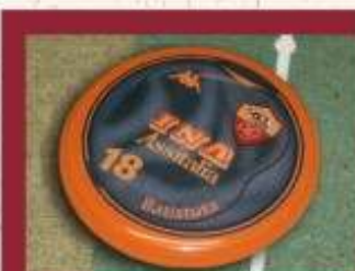
Batistuta, artilheiro da Roma