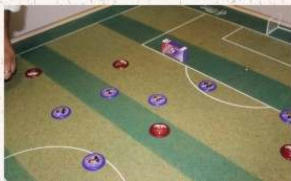
Time de Florença não passa pela Reggina em casa