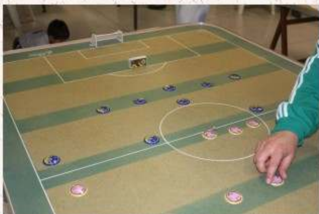
Palermo vence Verona em jogo emocionante