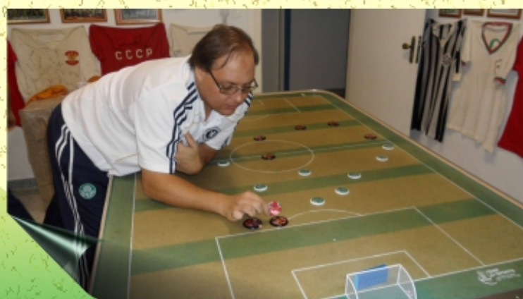
É O AMOR Mengão e Verdão jogam charme pra cima da Segundona