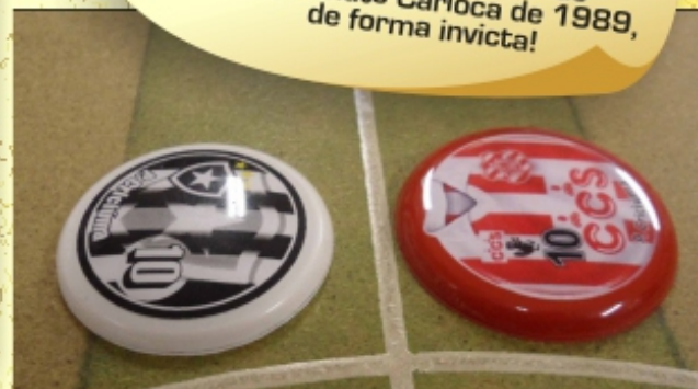
ELES Com Paulinho Criciúma dos dois lados, melhor para o alvinegro