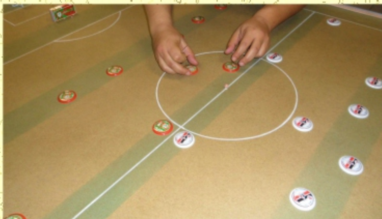
DECISÃO O Tricolor visitou a Portuguesa no Canindé e venceu um adversário direto pela liderança

A terceira partida do time do Morumbi foi contra o Internacional do técnico Dadá e, jogando em seus domínios, o São Paulo mais uma vez se impôs e goleou os gaúchos por 5 a 3, com Dagoberto, Ricardo Oliveira e Lucas na 1ª etapa, enquanto que Alex e Tinga marcaram para o Colorado. Na etapa final, de novo